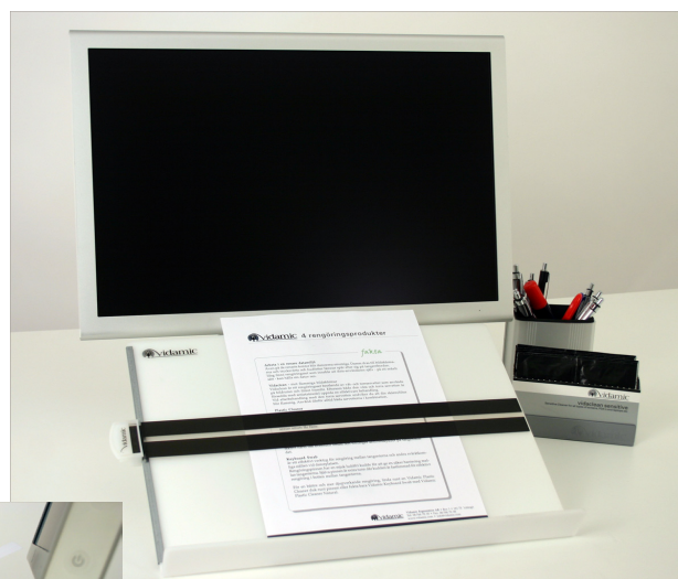
Art No 65 895