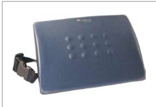
Art Nr 65 120 Back Support Technogel