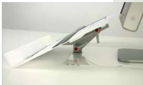
Art No 65 895