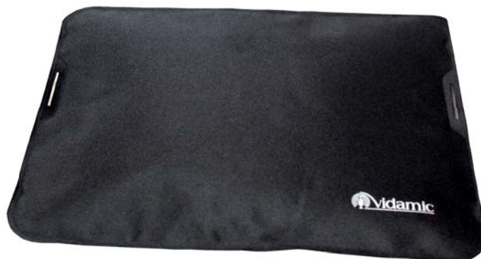
Art No 65 860