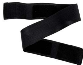
Art No 65 861